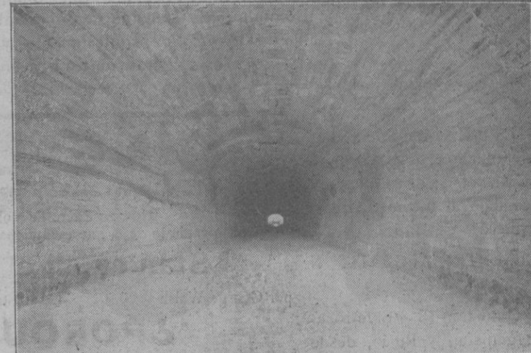
F. C. Metropolitano de Barcelona S. A. Aspto de los túneles del Metropolitano

Por fortuna se notó la deficiencia de vías para transportes, pavimentación, cloacas, urbanización de zonas de ensanche, alumbramiento y canalización de agua, etc. Su obra capital ha sido hasta el presente la construcción del Ferrocarril Metropolitano de Barcelona, llamado Trans-