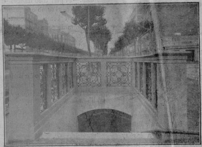
F. C. Metropolitano de Barcelona S.A. La escalera de descenso a la estación de Rocafort

Una de las manifestaciones más trascendentales de la vida moderna de los negocios es la fundación de grandes empresas que acumulando inmensos parques de construcción pueden tomar a su cargo las obras de mayor vuelo para la renovación y el fomento de un país.