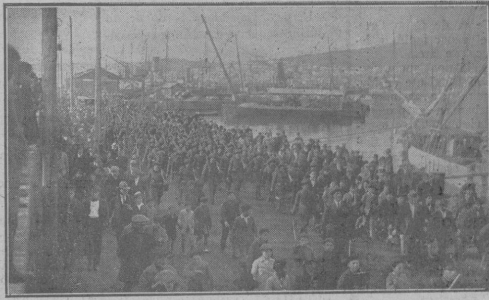
Las tropas expedicionarias al desfilarse por el muelle al mando de su Comandante Sr. Fiol