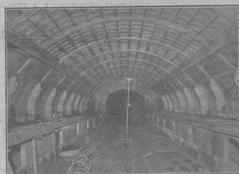
F. C. Metropolitano de Barcelona, Un extremo de la estación Rocafort con la decoración terminada