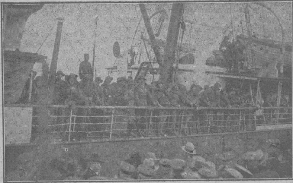
Las fuerzas expedicionarias a bordo del vapor «Caballero»