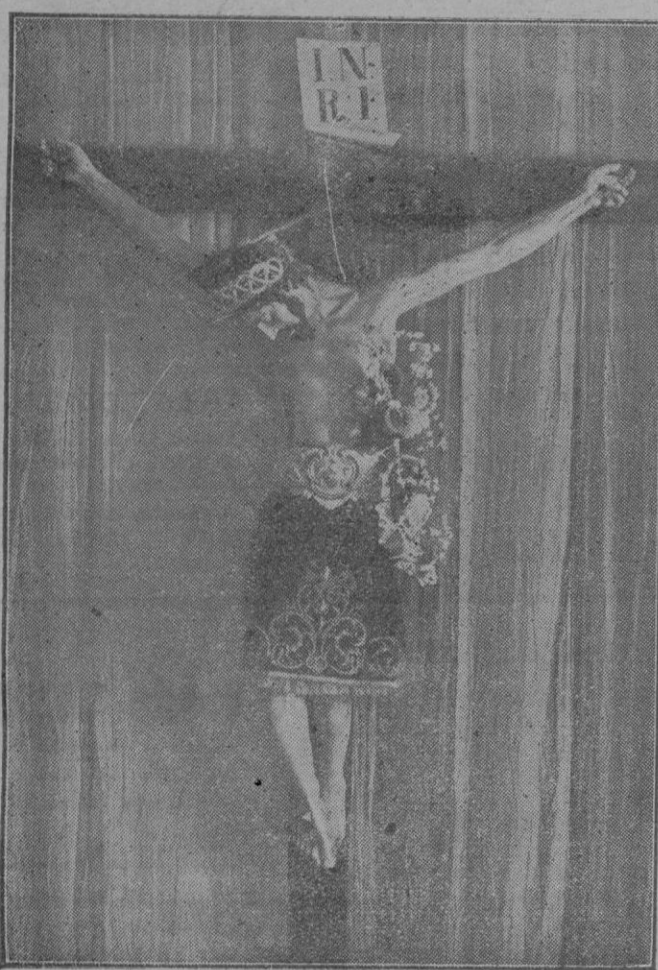
El Santo Cristo de los Navegantes