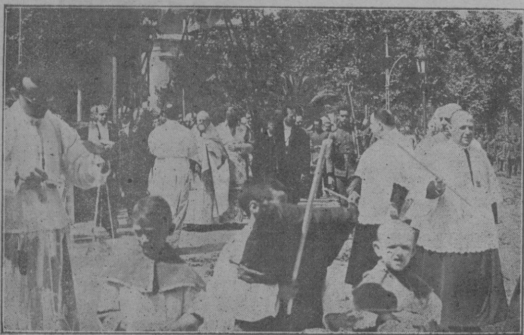
El Ilmo. Obispo de Mallorca llevando el Santísimo en la procesión