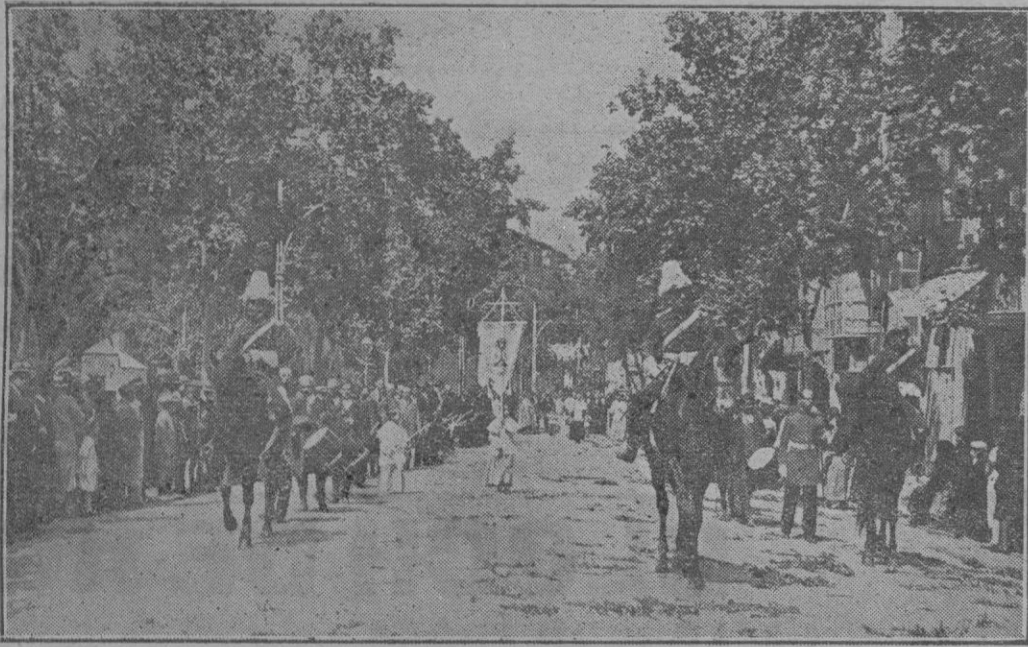
La cabeza de la procesión celebrada el domingo último para trasladar a Santísimo a nueva iglesia de las Reparadoras, al pasar por la que fué plaza del Mercado.