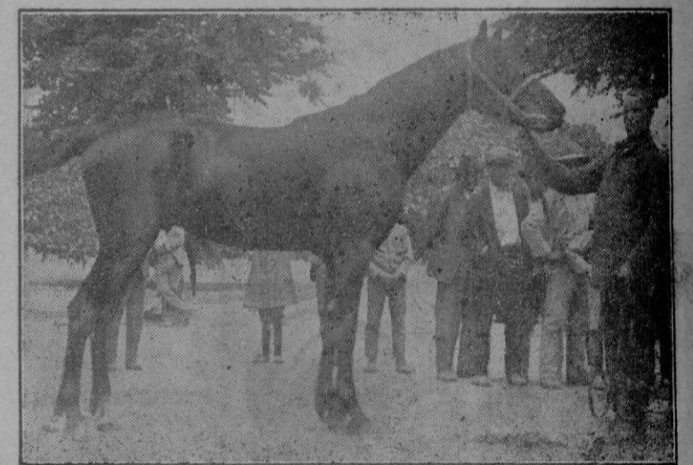
Bouito j mpar premiado con uno de los primeros remica

Nueva-York.—El secuestro y rescate del niño de catorce años Robert Franks, hijo del millonario de Chicago del mismo apellido, ha producido honda impresión en esta capital. Los eródicos dedican al asunto columnas enteras con detalles minuciosos relativos a la forma en que la Policía procedió para