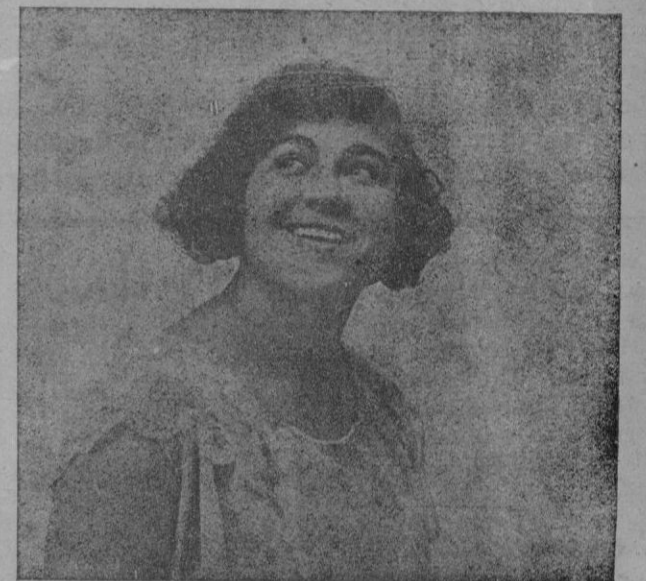
La notable canzonetista Pilar Alonso que está trabajando con amoroso éxito en el Teatro Principal.