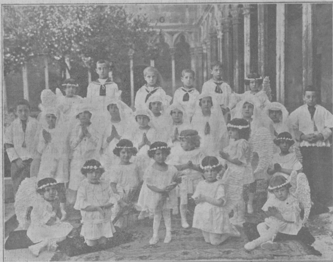
Grupo de niños y niñas después de la solemne Primera Comunión, en el histórico claustro de San Francisco.

silencio... y razonaba el porqué de mi hablar. Así ahora, vuelto a Mallorca, a la que «descubrí» para mi emoción y goce puros el año pasado, instalado aquí con los míos y dispuesto a vivir pintando y «viviendo» en la Isla años y años, sin ningún deseo ni necesidad de llamar la atención de los vanos, amigo del silencio y de la intimidad perfectos, por razones que entiendo valen más que el temor de pasar ante la opinión de las gentes por deseador del popular halago, un poquito estimulado por el éxito de mi proposición madrileña, me dirijo a unos cuantos hombres de esta maravillosa Mallorca o que en esta Mallorca viven y de los que tengo el más fijo conocimiento o la más cierta referencia y a sabiendas de que he de decir algo que vale un poquitín más que el silencio, al-tero este y digo: