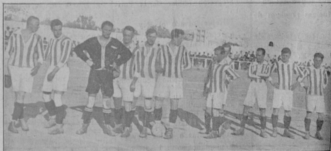
El team checo «Meteor».