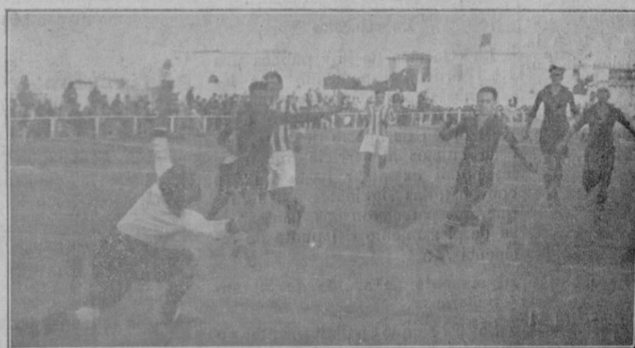
Los del «Meteor» apretando al portero del «Alfonso XIII».