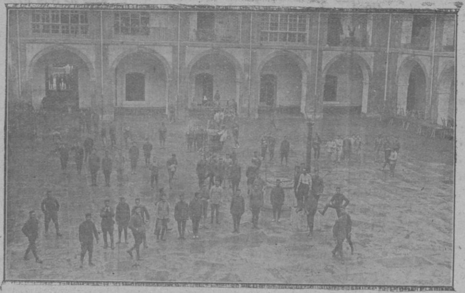
Nuestros soldados en el patio del cuartel de Sevilla