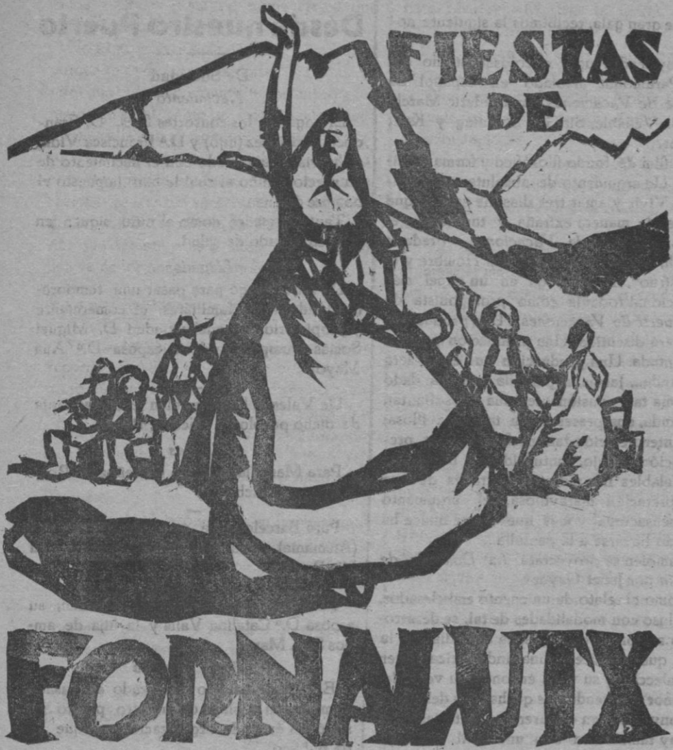
Grabado al boj de Ronald Hargrave

PROGRAMA de los festejos cívico religiosos que se celebrarán en esta villa durante los días 7, 8 y 9 de Septiembre en honor de su Patrona la Natividad de Nuestra Señora