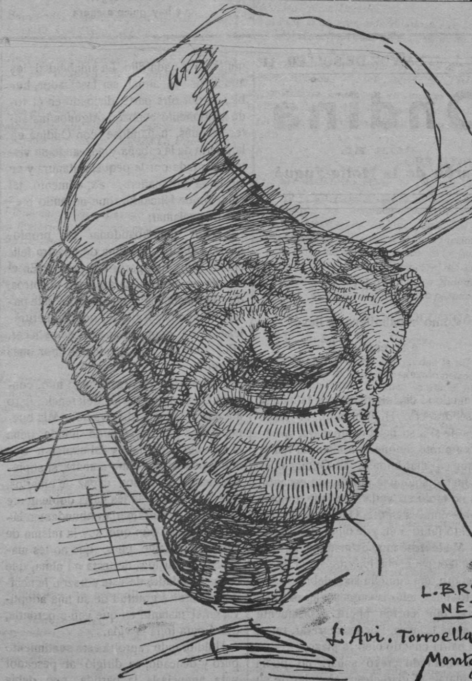
Un viejo «rebassaire» catalán