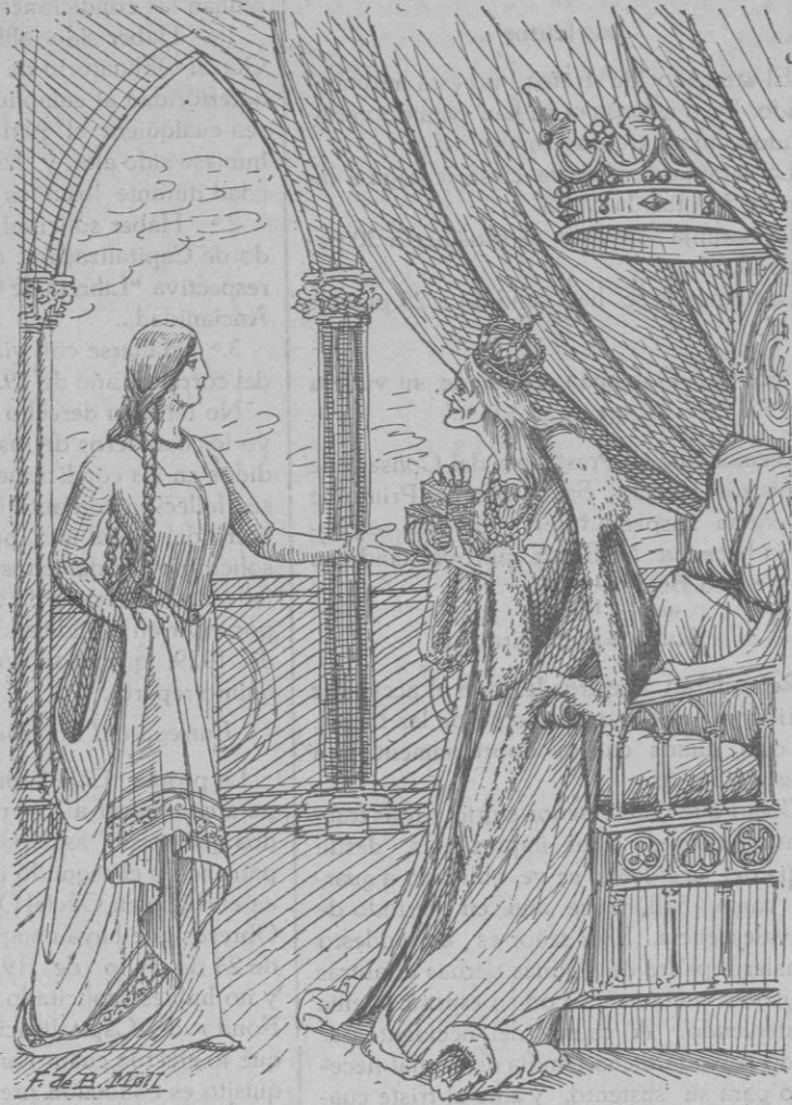
La senyora Reyna des Castell dona, a la fi, sa capsa del Bon Jorn.

Y Na Juana despedintse ab mil cortesies de la Reyna des Castell, ja és partida com la bala de d'allà cap a ca-la Reyna Morgana, sensa trobar en-lloch cap nosa per passar, ni jayes, ni forners, ni coves ni camps rasos, sino que el punt va esser a ca-la Reyna Morgana.