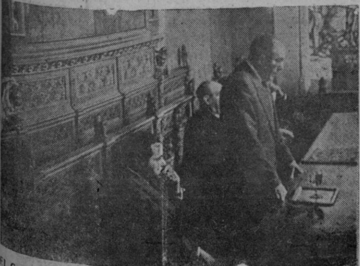
El Comisario General de Excavaciones examinando en Artá (arriba) y en Manacor (al centro) ejemplares arqueológicos sobre los que basó importantes afirmaciones en la conferencia (abajo) ada el sábado en la Diputación.

MANILA, 10 (Efe). — El ministro del Aire español, Teodoro González Gallarza, llegó felizmente a Manila, procedente de Madrid. La capital filipina le dispuso grandioso recibimiento al héroe del vuelo Madrid-Manila, efectuando hace 25 años.