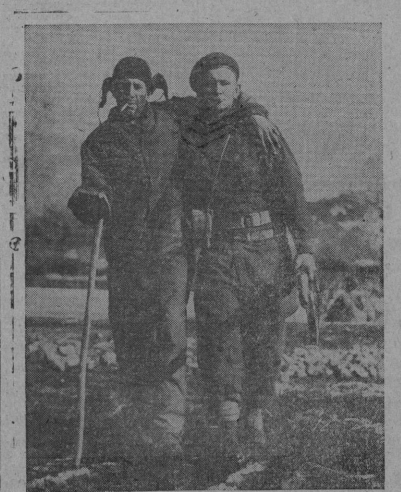
Plastic. — Un soldado australiano, (derecha), ayuda a un norteamericano a andar, después de una batalla sostenida e Corea contra las fuerzas de la agresión comunista.

Estos son los atinados consejos que Helen Rose brinda a las jovencitas en general sea cual sea su tipo, pues todas pueden estar elegantes si saben elegir lo que mejor les sienta.