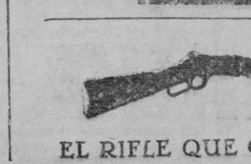
EL RIFLE QUE CONQUISTO EL OESTE

Gran creación de toda la Compañía de TEATRO REGIONAL titular del Principal 120 sonrisas en cada escena! 1347 risas en cada acto! y una carcajada general desde que empieza la obra hasta que termina. ¡No se pierda esta ocasión de reír! ¡De reír y de llorar... de risal!