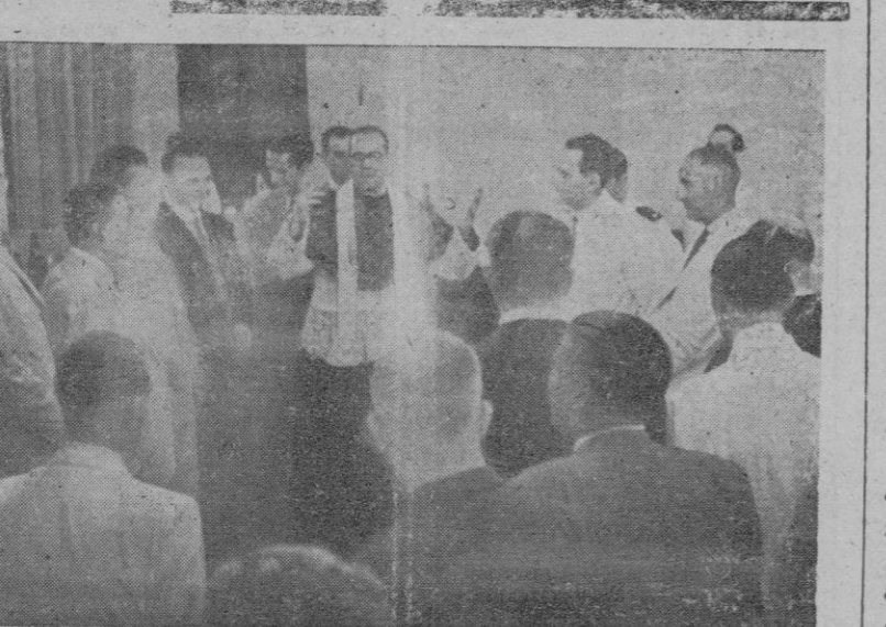
Momento de la bendición de los nuevos locales

En las rúta saera, el nombre de «Aviación y Comercio S. A.», ha cobrado un merecido prestigio al alcanzar sus servicios de transporte inabundables éxitos comerciales.