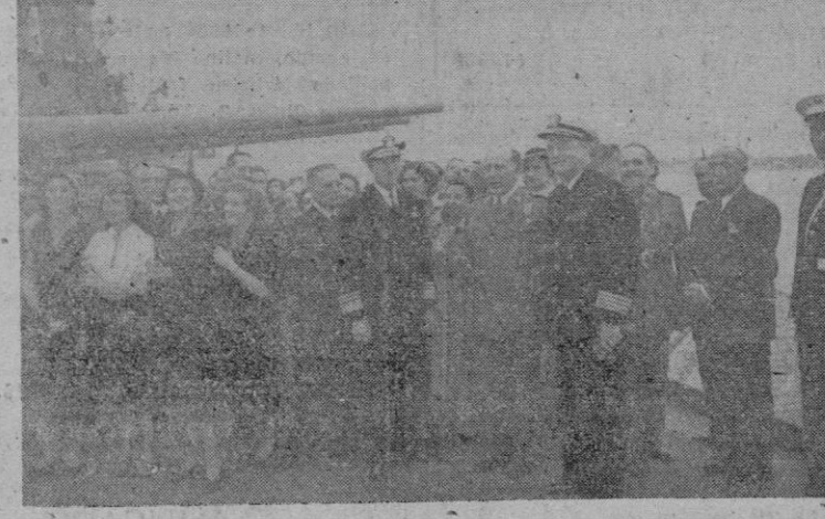
Nuestras autoridades acompañadas del Almirante Ballentine presenciando el despegue del Helicóptero