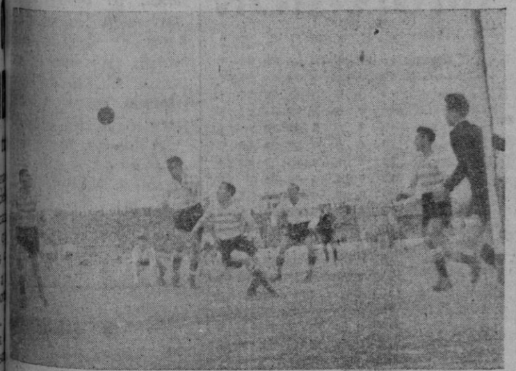
Momento del partido jugado ayer en "Es Forti" en el cual el "Constancia" venció al "Sana".

Quisiéramos encontrar entre nosotros iguales actividades, capaces de dibujarnos perspectivas idénticas. Porque también Mallorca se encuentra a escasa distancia del camino que desde el Occidente conduce a la capital de la cristiandad, y porque aún alienta en el espíritu la añoranza de las épocas en que era el nuestro un puerto de escala en las grandes rutas turísticas. No es la inercia el método más adecuado para el progreso: si por ella se sigue el momento recibido de una fuerza exterior, es ella misma la que ocasiona el cese cuando esta fuerza ha dejado de actuar.