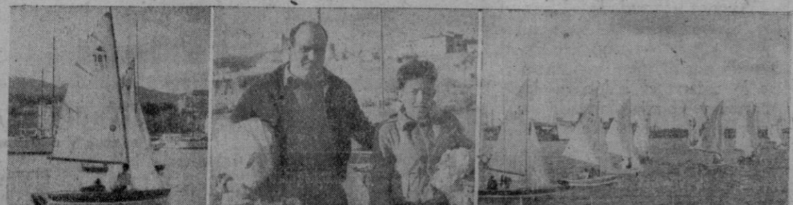
El "Biniarroca", snipe vencedor del Campeonato de Baleares, su patrón, Sr. Rita y un aspecto de la prueba.

LA ULTIMA HORA al despedir al Ilustre Embajador y distinguidos acompañantes, les desea un feliz viaje y un pronto retorno.