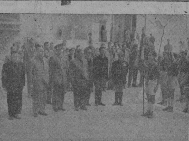
Presencia del Frente de Juventudes en los actos conmemorativos de la muerte del Fundador