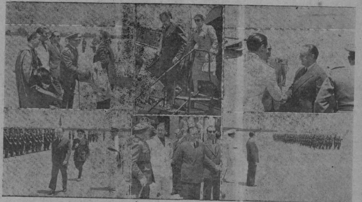
Notas gráficas de la llegada del Ministro

Pero ¡hijos de mi corazón! para acuciar vuestro interés en este momento solemne, punto de partida de la gran empresa, y para disponer el