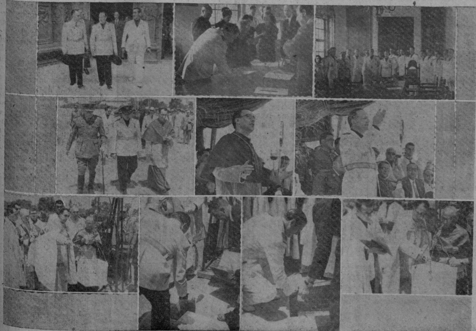
Algunos aspectos de las solemnidades de ayer