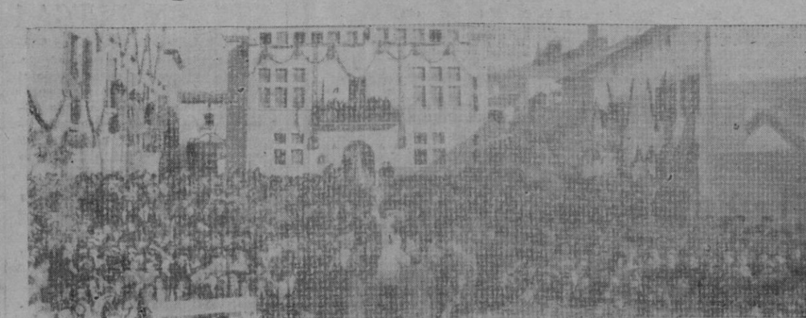
Un aspecto del solemne acto celebrado ayer en la villa de Artá