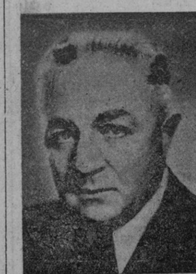
NICOLA PETKOW el leader de la oposición búlgara que fué ejecutado ayer, apesar de las notas de protesta anglo-sajona