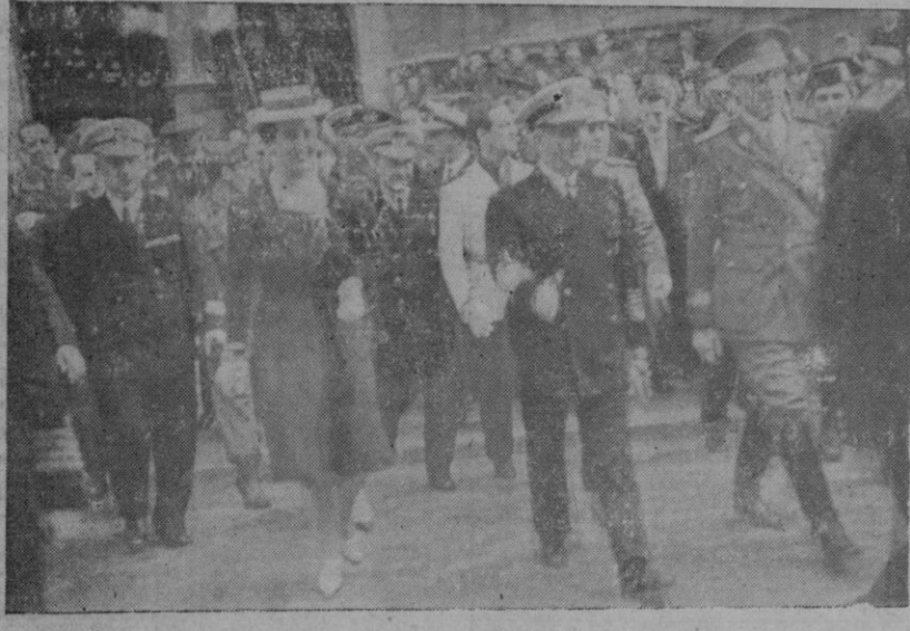
EL JEFE DEL ESTADO Y SU ESPOSA SALIEN DE LA CATEDRAL