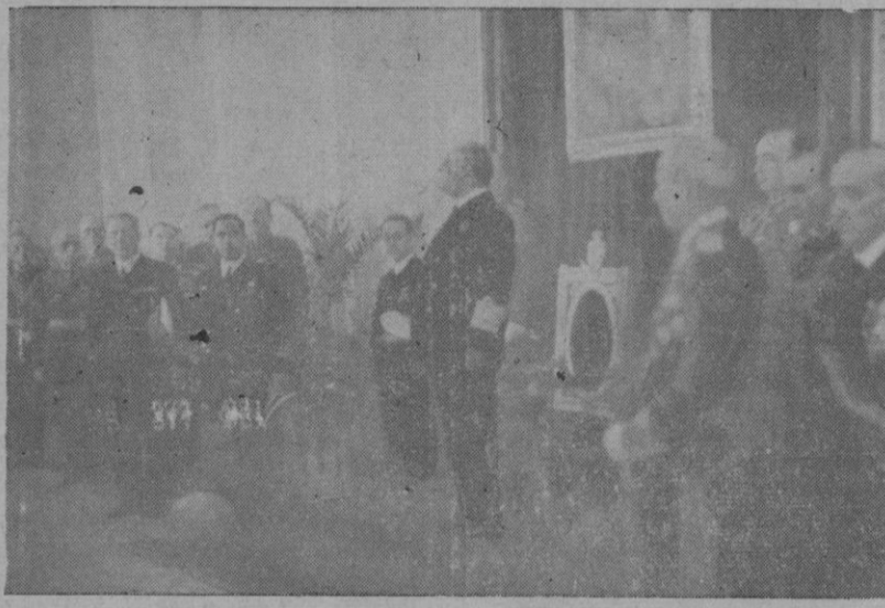
EN EL SALON DEL TRONO DEL PALACIO DE LA ALMUDAINA

Poco tiempo después irrumpió S. E. en las habitaciones del Palacio, acompañado de su esposa y de su hijo, Ministros de Industria y Comercio, Marina, Capitán General de Baleares, el gobernador. Alcáide y su séquito. Produjose en tales momentos, una prolongada salva de aplausos, por parte de las numerosas comisiones, representaciones y entidades