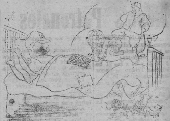
EL SUEÑO DE UNA NOCHE DE VERANO por Plá