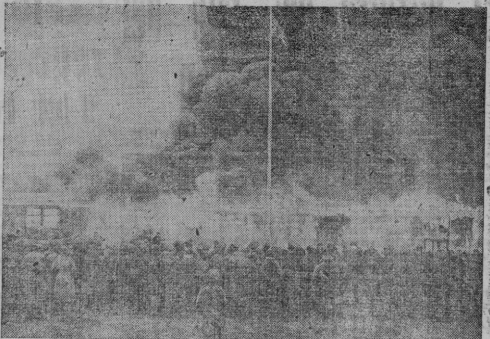
El ya histórico campo de concentración de Belsen, donde, después de haber sido incendiado por los británicos como medida de precaución contra las enfermedades infecciosas.

Los congresistas de Pesca y las jerarquías que se encuentran en Vigo, efectuaron una excursión a La Guardia visitando los restos de trancas celtas en el monte de Santa Tecla.