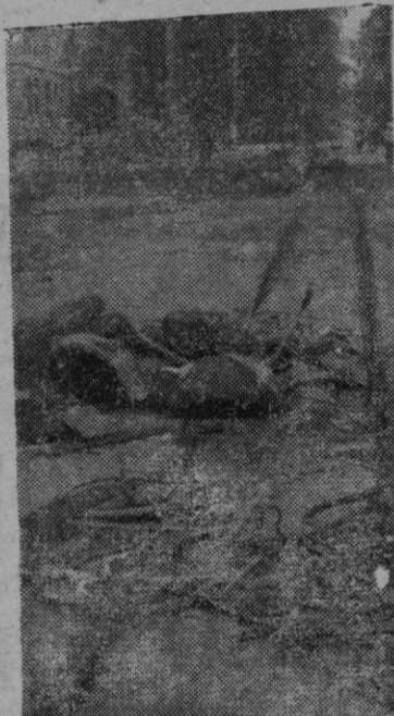
La guerra aérea

Información telegráfica en páginas 7 y 8