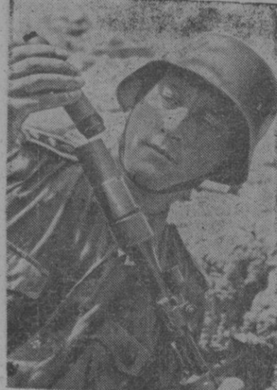
BOMBAS DE MANO CON FUSIL.—He aquí una arma nueva que se emplea por los granaderos alemanes para disparar bombas de mano con los fusiles. A estos se adapta un sistema especial que precisa la colocación de la bomba de mano, especialmente contra tanques.