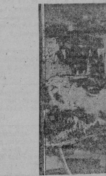
LA ESTELA DE LAS RETIRADAS ROJAS.—Este es el aspecto que ofrecen las carreteras después de la retirada de los soviets y la actuación de los "stukas" alemanes.

Por ejemplo todo el tiempo que lo ha permitido el número de buques correos, ha dispuesto un servicio extraordinario semanal de Palma a Barcelona y viceversa. Para ello como es natural no ha servido más, a pesar del buen deseo, que para aliviar un tanto la situación, pero no para solucionarlo.