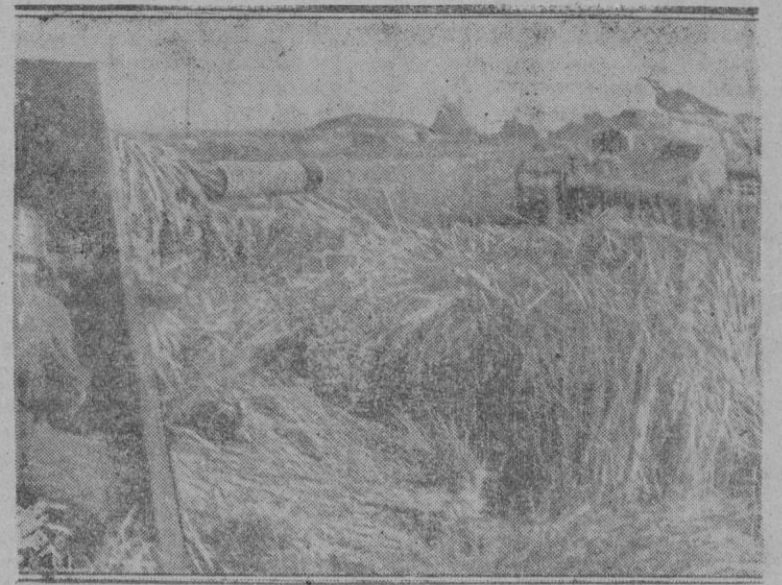
SERENIDAD DE LOS ANITANQUISISTAS ALEMANES.—Este anita que al nán dejó acercarse al tanque ruso tipo T-34 hasta tan sólo 20 metros de distancia. Un disparo perforó la cúpula y acabó con la tripulación bolchevique dejando inerte al coloso.

El día 12 por la mañana se celebrará en la iglesia de San Felipe el Grande una misa en sufragio de las almas de los Reyes Católicos Don Fernando y Doña Isabel, del Almirante don Cristóbal Colón y pilotos y tripulantes de las naves que descubrieron el Nuevo Mundo. Por la noche, en el día de la hispanidad, tendrá lugar en el teatro Español un concierto de música española y se representará por la compañía del teatro Español el auto sacramental de don Pedro Calderón de la Barca, «El precio matrimonial del alma y del cuerpo». Además de este acto el mismo día de 12 a 14'30, el Ministro de Relaciones Exteriores de la Argentina doctor Ruiz Guisasa pronunciará un discurso con motivo de la fiesta que se conmemora y que será retransmitido por Radio Nacional de España. El Conde de Jordana contestará a continuación del discurso del Ministro de Relaciones de la Argentina entablándose así un diálogo de exaltación hispanoamericana entre los Ministros de Asuntos Exteriores de ambos países.—Cifra.