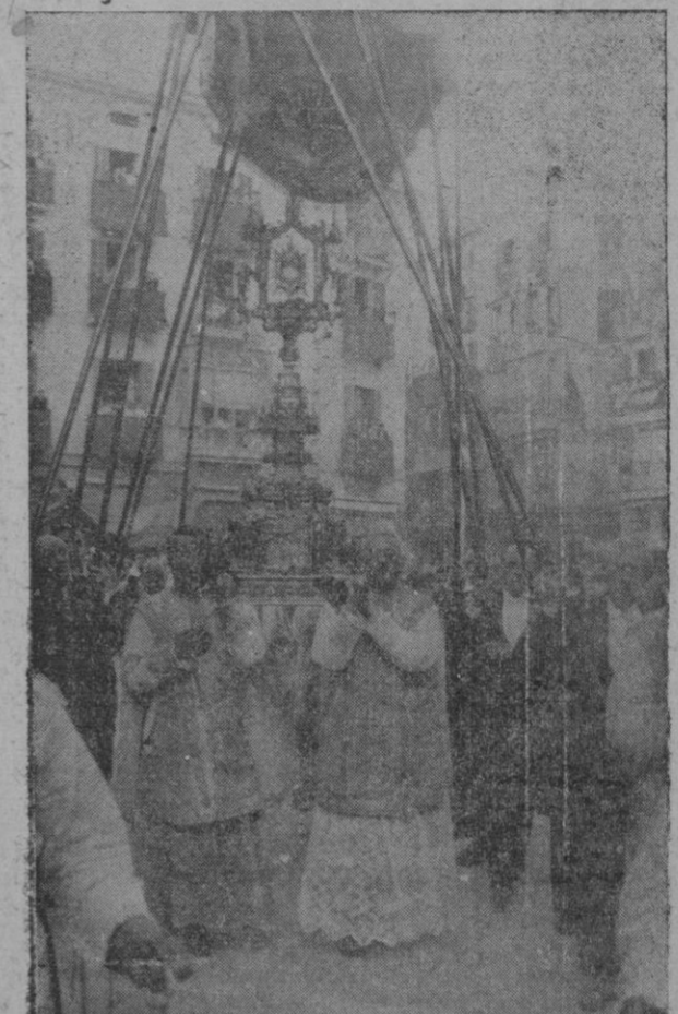
La procesión palmesana a su paso por la Plaza de Cort