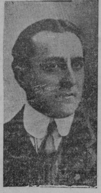
RAMIRO DE MAESTU

Maestu elevaba el pensamiento, lanzándolo fuera de las fronteras españolas para llevar a todas partes el alce del genio de nuestra raza y de nuestro pueblo. El hondo pensar y el sereno sentir de Ramiro de Maestu pudieron concebir, en toda la amplitud maravillosa de su importancia, la visión admirable de la Hispanidad. Insigne escritor y poderoso espíritu, no vaciló en la ruta. Y las obras de Ramiro de Maestu abrieron claros surcos para el aunar de España, y unificaron más y más el corazón español y los corazones de los pueblos hermanos que son, en tierras de América, los continentes de nuestra historia y los herederos copartícipes de nuestra alma imperal. Recordemos a Ramiro de Maestu al recordar a los Caidos, entre los cuales tiene su personalidad la gran prestancia que le da su obra gigante. Recordémosle, con el amor ferviente que bien ha conquistado el propulsor más lustre de ese sentir de Hispanidad que hoy llena nuestros pechos con latidos rotundos, y marca la unión espiritual de nuestro pueblo con los pueblos de América.