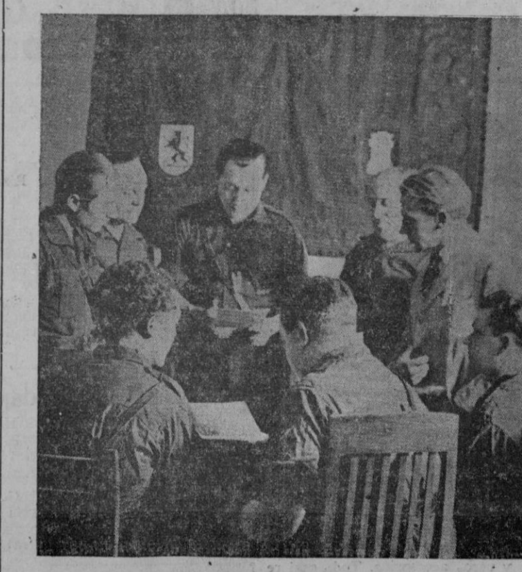
Una reunión de la primera Junta Política de la Falange

Maestu elevaba el pensamiento, lanzándolo fuera de las fronteras españolas para llevar a todas partes el alce del genio de nuestra raza y de nuestro pueblo. El hondo pensar y el sereno sentir de Ramiro de Maestu pudieron concebir, en toda la amplitud maravillosa de su importancia, la visión admirable de la Hispanidad. Insigne escritor y poderoso espíritu, no vaciló en la ruta. Y las obras de Ramiro de Maestu abrieron claros surcos para el aunar de España, y unificaron más y más el corazón español y los corazones de los pueblos hermanos que son, en tierras de América, los continentes de nuestra historia y los herederos copartícipes de nuestra alma imperal. Recordemos a Ramiro de Maestu al recordar a los Caidos, entre los cuales tiene su personalidad la gran prestancia que le da su obra gigante. Recordémosle, con el amor ferviente que bien ha conquistado el propulsor más lustre de ese sentir de Hispanidad que hoy llena nuestros pechos con latidos rotundos, y marca la unión espiritual de nuestro pueblo con los pueblos de América.