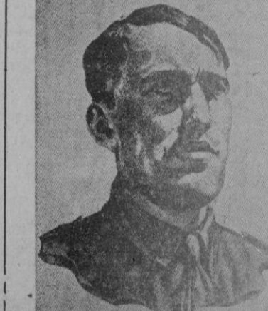
JULIO RUIZ DE ALDA