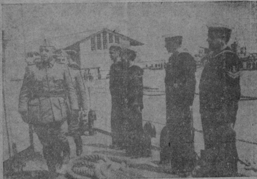
Mirando el Caudillo por el porvenir Imperial español, dedica atención especial a nuestra Marina de Guerra