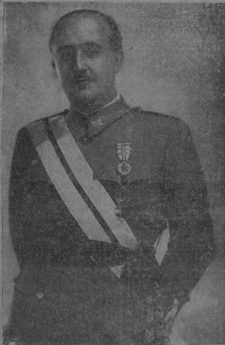
Franco, franco, franco

Y fué su proclamación, que acogió el pueblo con vítores vibrantes, con entusiasmos indescribibles, algo así como el cristalizar de la gratitud española en un acto de justicia.