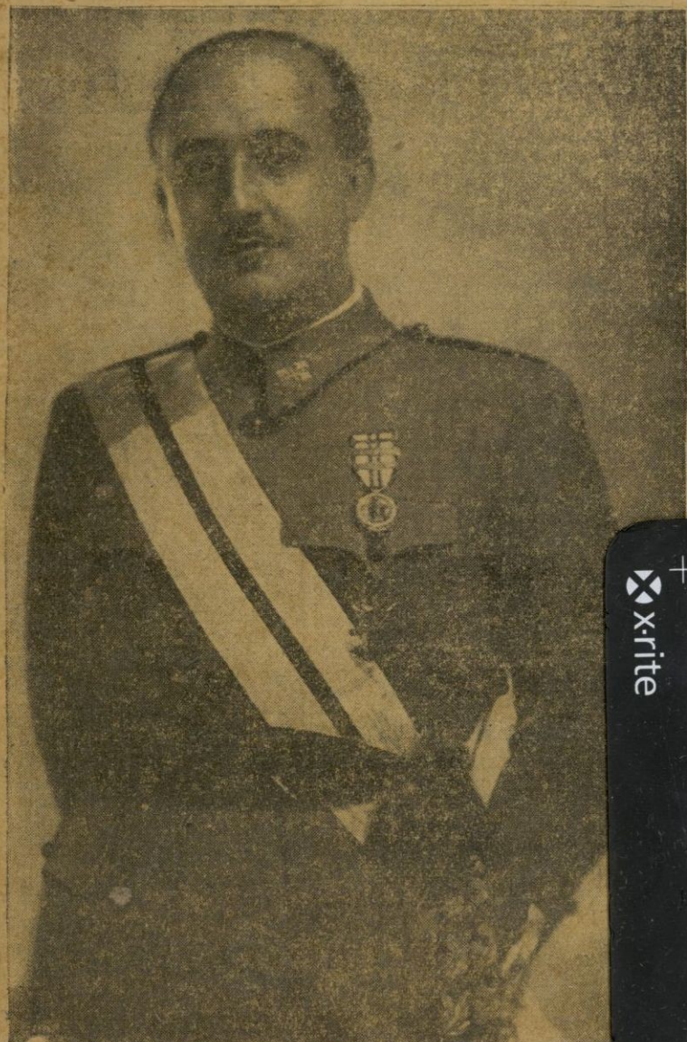
Francisco Franco, Franco, Franco

Y fué su proclamación, que acogió el pueblo con vibrantes, con entusiasmos indescriptibles, algo así como el eco de la gratitud española en un acto de justicia.