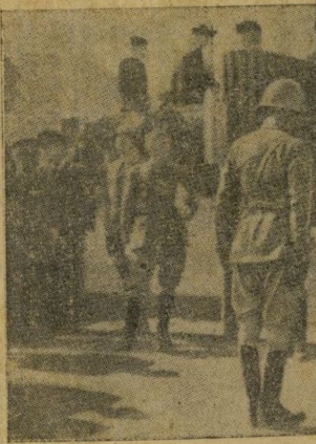
El Ejército, en cuyas filas el Caudillo es objeto de cuidado preferente