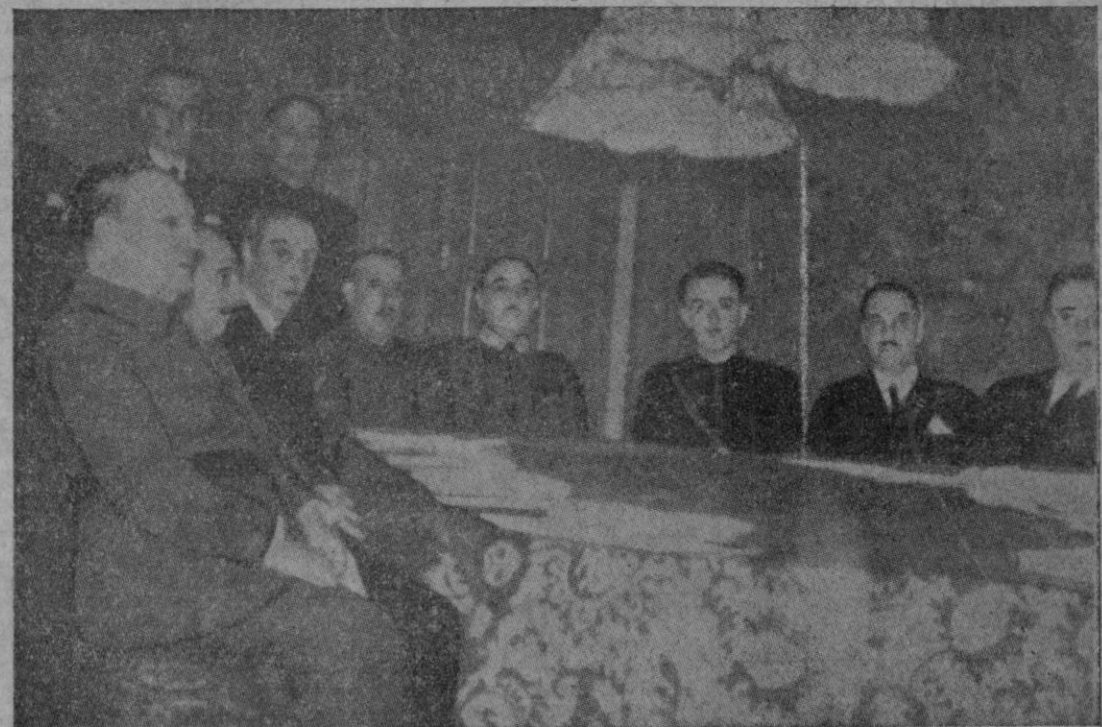
Presidiendo las reuniones del Consejo de Ministros, S. E. el Jefe de Estado marca las directrices de una política en caminata exclusivamente y siempre al bien de España

La juventud de España deberá al Caudillo, como el pueblo todo, una liberación que a todos nos honra por igual, pero al mismo tiempo le deberá particularmente un impulso gigantesco y una lección eterna de bien, de sacrificio de patriotismo inmaculado, que no puede, que no debe olvidar jamás.