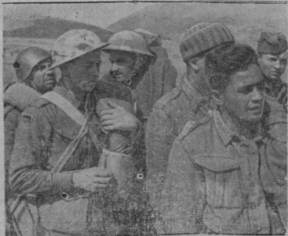
La campaña en el Este no ha amenguado la lucha que se viene sosteniendo en Aftia. He aquí unos prisioneros ingleses

Esta gran película española, creación de Antonio Vico, será estrenada en el Cine Born, el próximo día 1 de octubre.