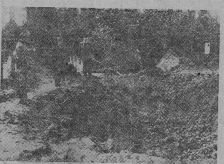
LOS BOMBARDEOS INGLESSES EN ALEMANIA.—Efectos de una bomba inglesa de gran calibre lanzada sobre un barrio de las cercanías de Hamburgo. Como es natural, por el lugar, la bomba sólo produjo daños.

Buscando los ejemplos en las normas que siguen las organizaciones similares relacionadas con el Trabajo en Alemania e Italia, vemos que en las Juventudes Hitlerianas y en las Organizaciones de las Juventudes Fascistas, es allí donde comienza la preselección con cursos de aprendizaje por los que pasan todos los aspirantes en general. Con el informe escolar y los dictámenes de los cursos de aprendizaje, se establece una calificación que dará el límite de aptitud. Desde este momento, el joven que va a ser dedicado de lleno al trabajo estará sometido a cursos especiales de estudio que harán de él con el tiempo, no sólo el obrero manual capacitado, sino el especialista que es, además, un verdadero técnico en la materia.