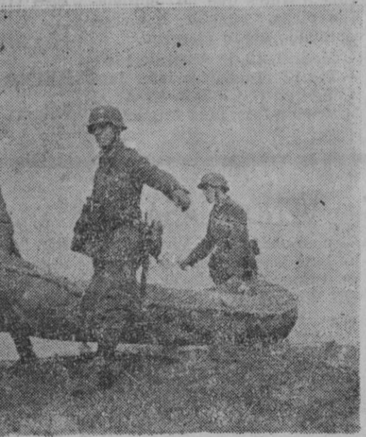
LOS EJERCITOS MODERNOS.—Una patrulla de tres zapadores alemanes se dispone a cruzar el río para proseguir la misión encomendada. Es curiosa la perfecta instrucción y equipo de estas secciones alemanas.