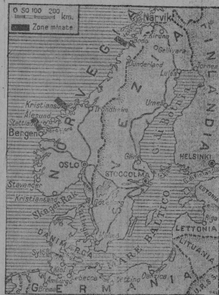
HE AQUÍ EL CAMPO DE LAS GRANDES OPERACIONES MILITARES Y NAVALES QUE SON HOY EL MOTIVO DE TODA LA ATENCION MUNDIAL. — LOS LUGARES MARCADOS CON RECTANGULOS NE GROS SON AQUELLOS EN QUE FUERON COLOCADAS LAS MINAS POR LOS INGLESES. — AL NORTE SE VE AL PUERTO DE NARVIK FRENTE AL CUAL SE RINIO EL PRIMER COMBATE NAVAL. — HOY LA BATALLA TIENE POR ESCENARIO EL SKAGER RACK

Berlín. — Un Boletín extraordinario que será publicado hoy relatará detalladamente los daños causados por la aviación alemana a la flota inglesa en los combates realizados en los días de ayer y de anteayer.