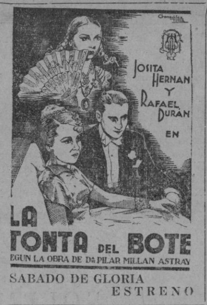
LA FONTE DEL BOTE EGUN LA OBRA DE DS PILAR MILLAN ASTRAY SABADO DE GLORIA ESTRENO