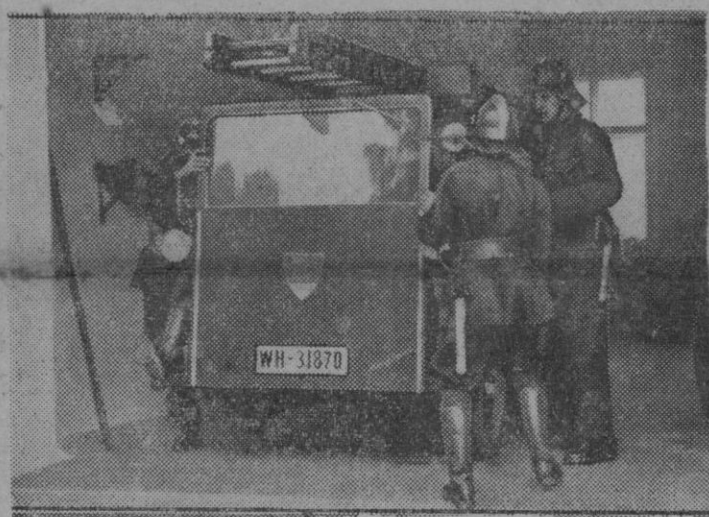
PARA LA DEFENSA ANTIAEREA DE BERLINA. — En Berlín se han montado unos servicios en coches pequeños muy rápidos para prestar socorros