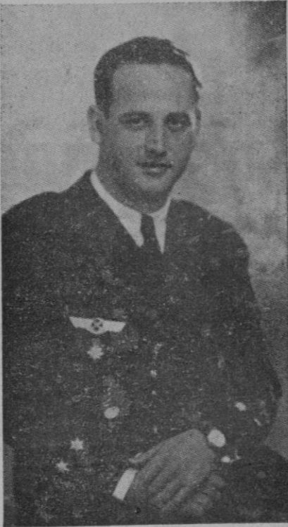
le distinguía por sus excepcionales dotes.

Tenía 36 años; era natural de Ceuta y provenía de las gloriosas filas de la infantería Española. Contaba con 1.500 horas de vuelo en servicio de guerra y ostentaba el record de aparatos enemigos derribados (41 seguros y 40 probables). El Caudillo