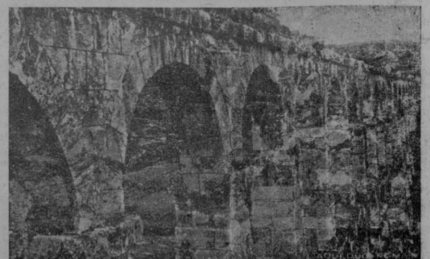
Tarragona.— El acueducto romano orgullo de la ciudad reconquistada para España