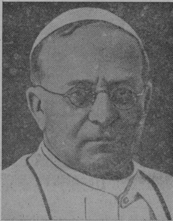
S. S. el Papa Pío XI que se halla en grave estado desde anoche y por cuyo restablecimiento hace votos todo el mundo católico