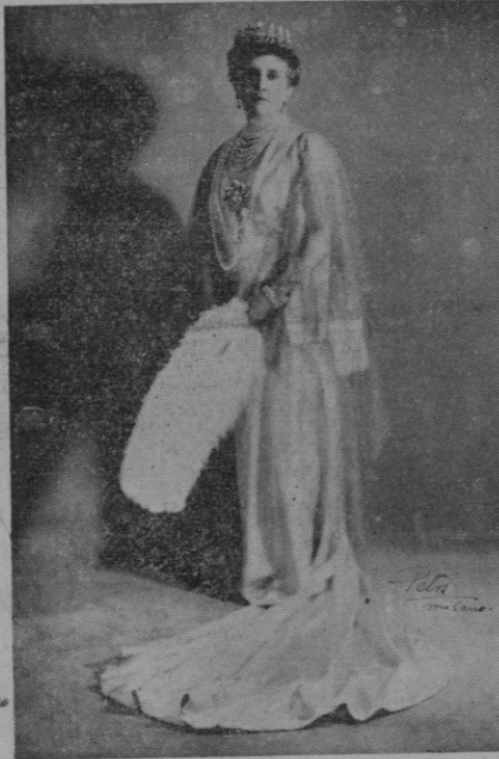
S. M. la Reina de Italia y Emperatriz de Etiopía

Si todo el valor de un hombre se mide por el grado de fidelidad con que ha cumplido la misión que Dios le ha señalado en la vida terrenal, no hay duda que la personalidad de Víctor