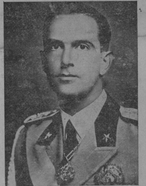
Su Alteza Real el Príncipe de Piemonte

Mussolini gracias a esta compenetración y colaboración se ha ahorrado la enorme y fantástica complicación que se ha ahorrado la enorme complicación y las graves consecuencias que hubieran entrañado el mantenimiento de terminados puntos de su primitivo programa revolucionario. La suerte que le deparó la Providencia al encontrar se con un soberano tan inteligente y tan impetuoso de su papel en la historia permitió a Mussolini realizar el milagro de llevar a cabo la más profunda de las revoluciones modernas sin tener que derribar "los cuatro pilares básicos del Estado y de la Nación" a los que se refirió en su discurso de Milán del 23 de Octubre de 1923: la Monarquía, la Iglesia, el Ejército y la Constitución. La Monarquía italiana, gra