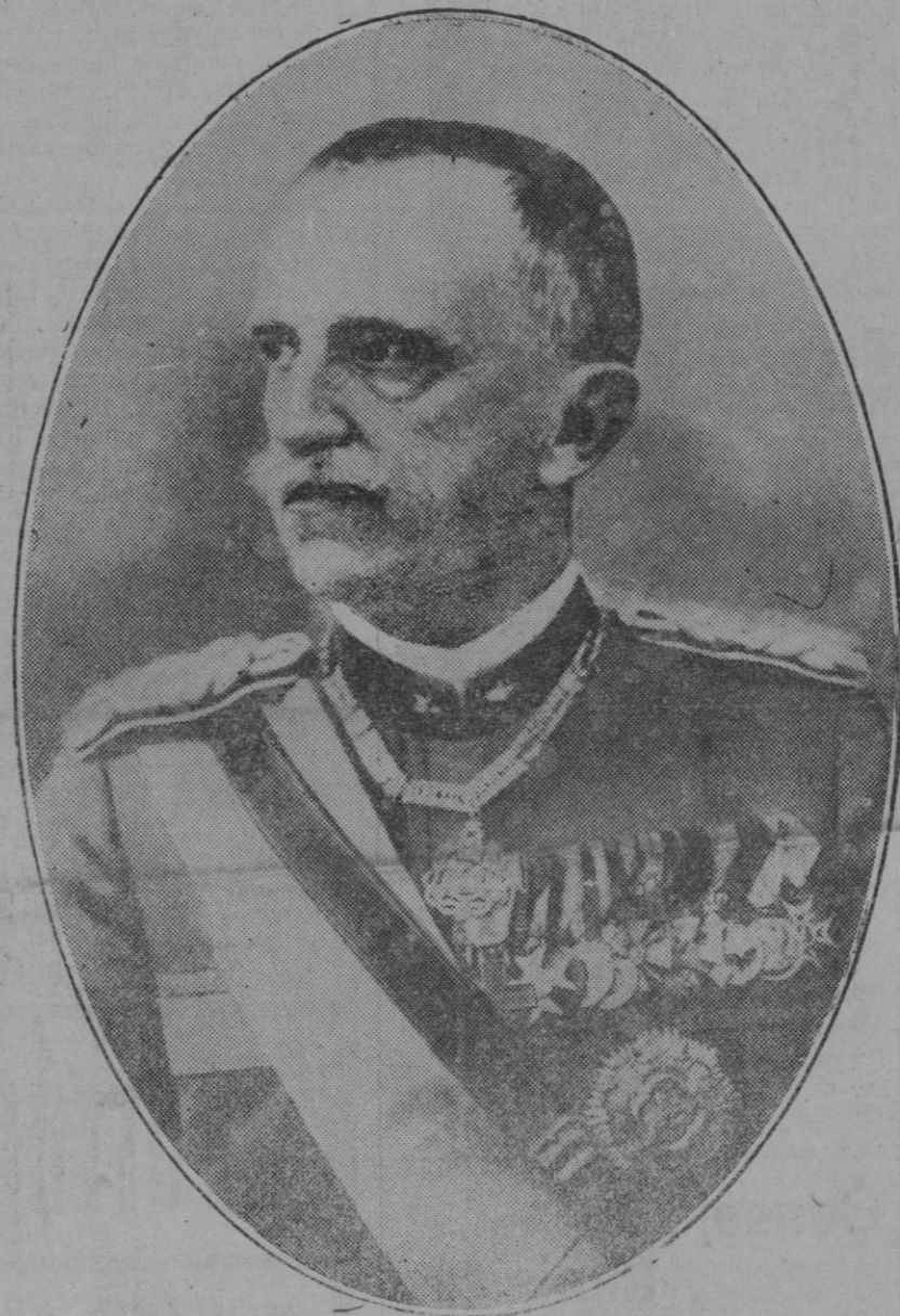
S. M. Vittorio Manuel III, Rey de Italia y Emperador de Etiopía

de su alta condición de supremo representante de su pueblo.