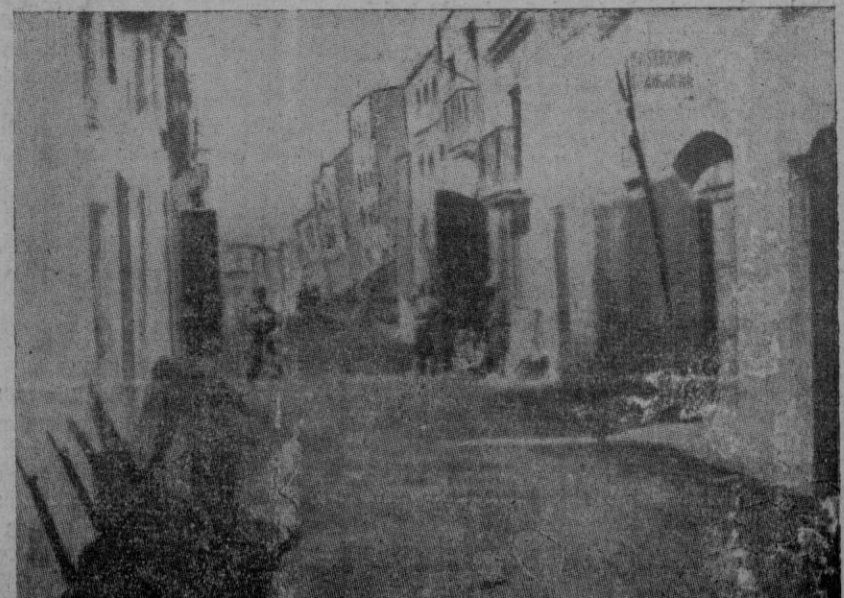
Otra calle de la parte de Tortosa ocupada por el Ejército Salvador.