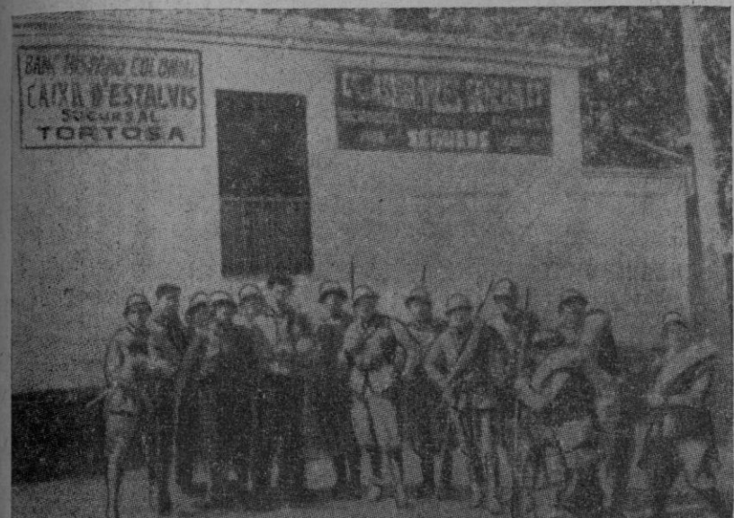
Caja de las calles de Tortosa situada a la derecha del Ebro, ocupada por las fuerzas nacionales

Ha sido ocupado el castillo de Chivert y otras posiciones cerca de Albocacer.—Al rechazar un contrataque enemigo les cogimos 207 prisioneros, mucho material y tres tanques rusos —Se rectifica a vanguardia nuestra línea en el frente de Granada.