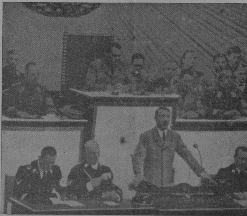
El Führer Hitler pronunciando su discurso que tan comentado ha sido en todo el mundo.