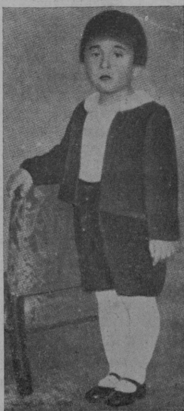
El heredero del Japón, al cumplir estos días sus 4 años.

Nadie ha podido saber como y porque ha nacido, en los órganos centra-