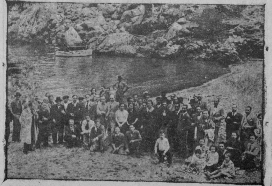
La excursión del Club Automovilista Mallorca. — Grupo de excursionistas al llegar a La Calobra.