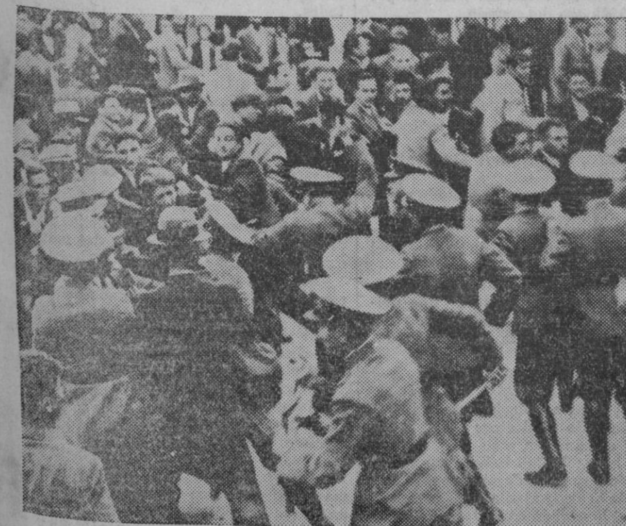
La policía de Atenas disolviendo una manifestación que se produjo con motivo de la huelga general allí declarada.