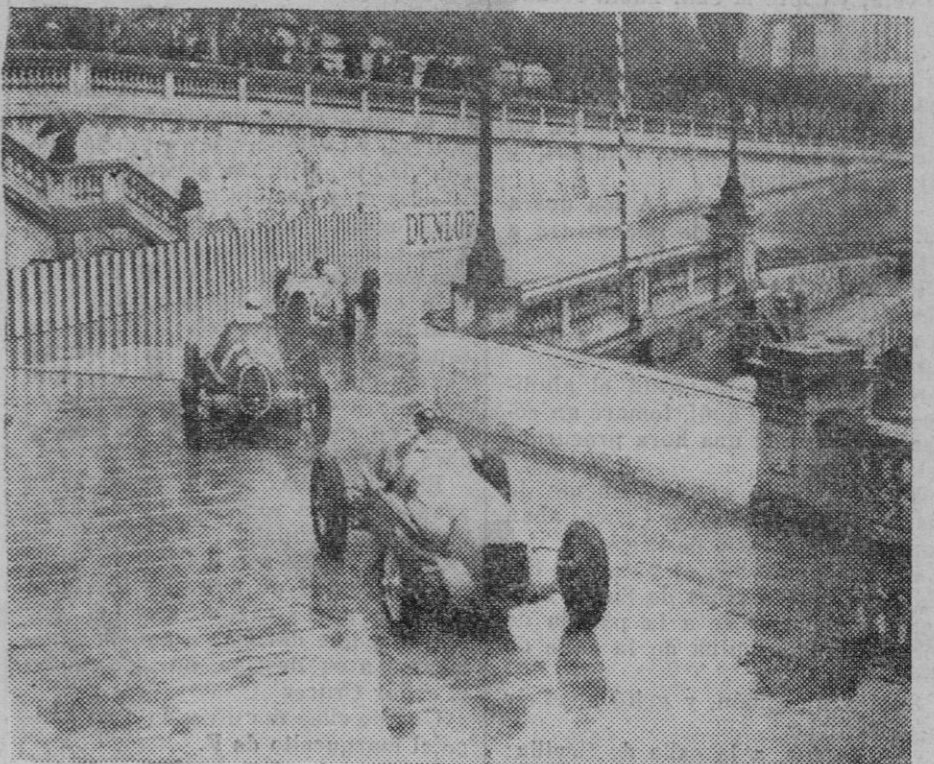
EL GRAN PREMIO AUTOMOVILISTA DE MONACO. — Ayer se corrió en Niza por 14. vez la carrera internacional del automovilismo para el Gran Premio Mónaco. He aquí un momento de la carrera en el viraje del «Quai de Plaisance», ETANCELIN, sobre Masarati, BRINO sobre Alfa y Stuck (2) sobre Auto-Unión quien resultó vencedor en la carrera.

—Contando con que la iniciativa individual cada día se ha de mostrar más reacia a cooperar a la acción del Estado, pretendimos incluir los socialistas en el programa del bloque popular la medida de la nacionalización de la banca y el de la movilización de ese enorme caudal congelado que significan las cuentas corrientes, tanto en el banco oficial como en los particulares. Para progresar hace falta dinero, y ahí precisamente se encontraba para que con él se beneficiara el país sin perjuicio de los dueños legítimos del dinero. ¿Para qué quieren sus consejeros? Los beneficios que con él se produzcan deben ser para el Estado que al fin es el beneficiario para todos. ¿Cree usted que no sería conveniente construir los pueblos de España? Causa dolor pensar en esas casas hechas de adobe, llenas de humedad, sin condiciones sanitarias, en las que más que vi-