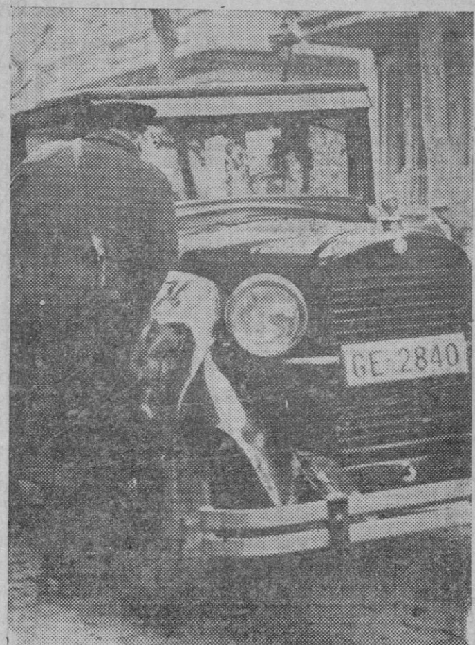
El automóvil que utilizaron unos pistoleros de Barcelona, después de cometer un atraco, y que cuando aquéllos huían chocó contra un árbol resultando herido uno de los pistoleros.