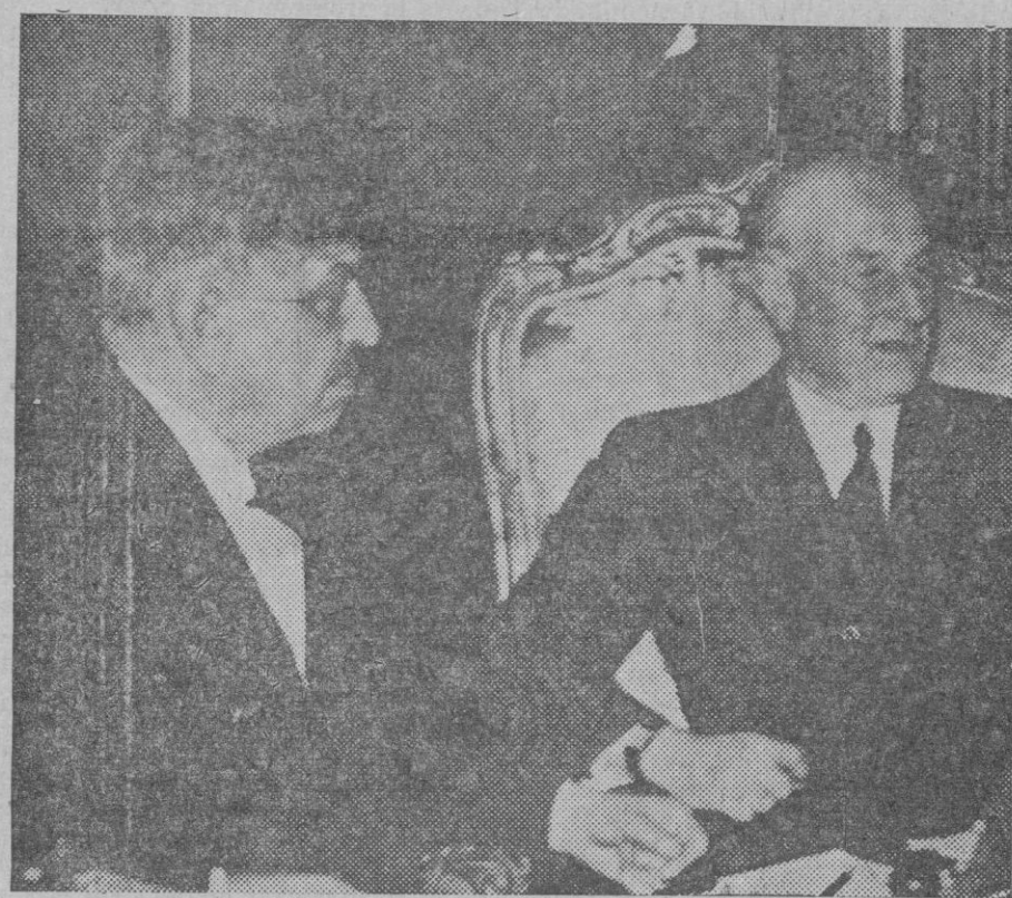
Los señores Laval y Hoare, reunidos en París, para estudiar una posible solución al conflicto italo-abisimio.

Al celebrarlo y felicitar a la empresa por el comienzo de las obras, deseamos que éstas se realicen felizmente y que consigan ser prontamente atendidos en su deseo de que sea construida la carretera que ha de dar acceso al lugar de donde arranca el funicular.