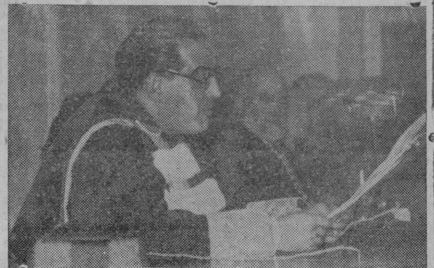
El Doctor Sr. Gregorio Marañón, pronunciando un discurso en el acto de apertura de curso en el Colegio de Doctores.