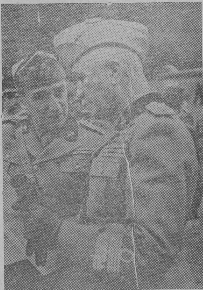
En primer término el Mariscal Badoglio, que se ha hecho cargo ya del mando de las tropas italianas que luchan en el Africa Oriental.

Esta sería una política buena, acertada y beneficiosa, y por creerla así por ella hemos abogado muchas veces, y en esta ocasión hemos de reiterarla ante el absurdo que supone pretender como se ha pretendido por espacio de cuatro años un arbitrio que económicamente nada hubiese representado y que en cambio suponía una mortificación más para el contribuyente.