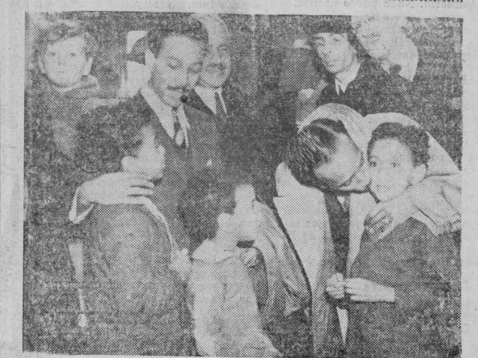
Los hijos del Ministro de Etiopía en Londres, despidiéndose de sus hermanos menores al partir para la guerra. (Express Foto).