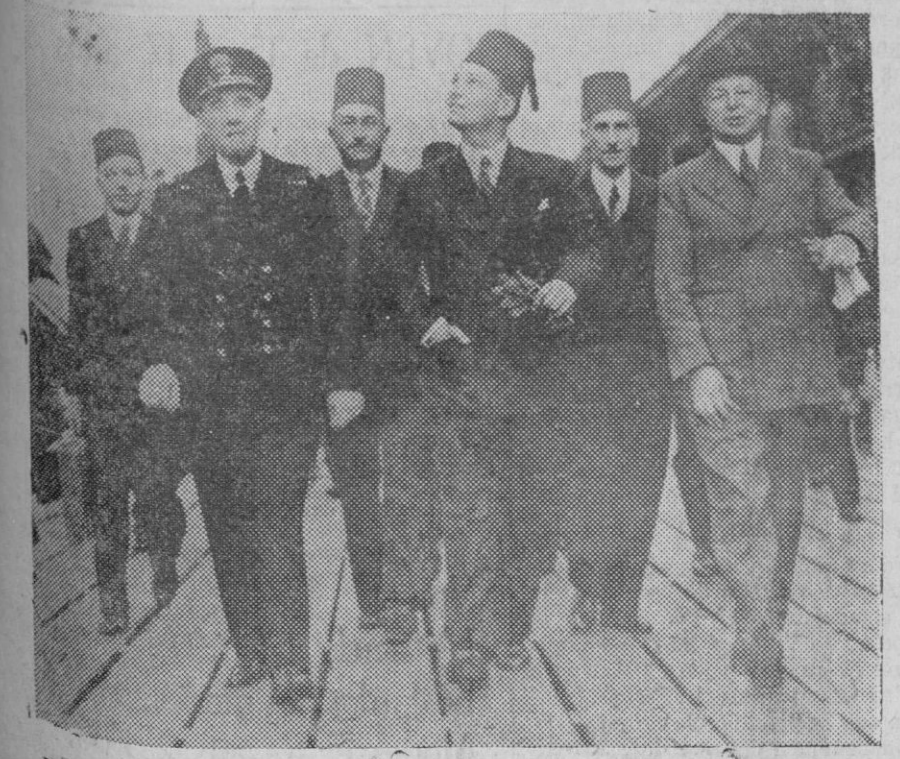
El Príncipe Farouk, heredero del trono de Egipto, a su llegada a Londres.