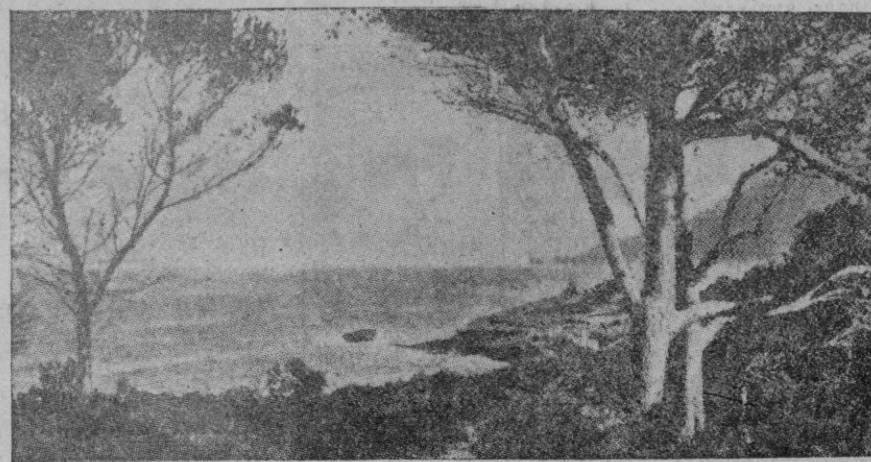
Raimundo Lulio, desde su cueva mallorquina, frente al mar Mediterráneo, lanzó su palabra gloriosa al mundo. Bajo los olivos torturados y dramáticos de Valldemosa, el genio daba una lección de paz interior al mundo