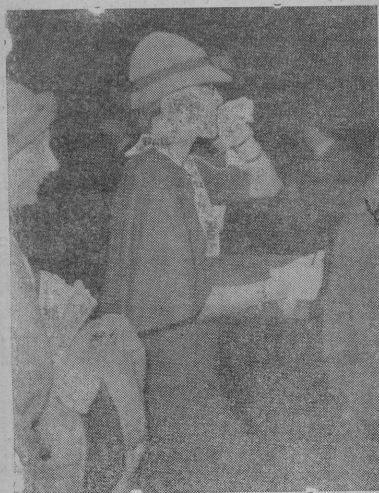
Restablecida ya de las importantes heridas sufridas en el accidente de automovilismo que costó la vida al príncipe Medivani ha llegado a París la Baronesa de Thyssen. La Baronesa lleva lentes negras y se tapa la cara para ocultar sus heridas.