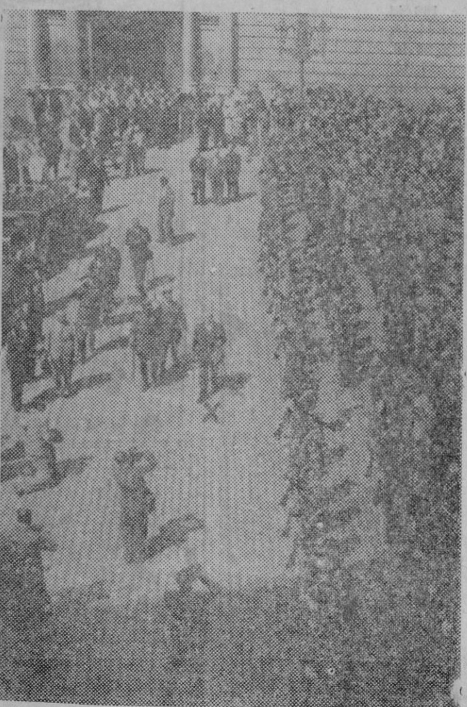
El Sr. Lerroux (x) pasando revista al cuerpo de Mozos de Escuadra en la Plaza de la República de Barcelona. (Express-Foto)

Este pequeño aparato contiene una emisora y un receptor de onda muy corta (cinco metros) con baterías y antena. Se puede telefonar sin hilo por mediación de este aparato a una distancia de 100 kilómetros. El precio de este aparato es de 375 pesetas. (Express-Foto)