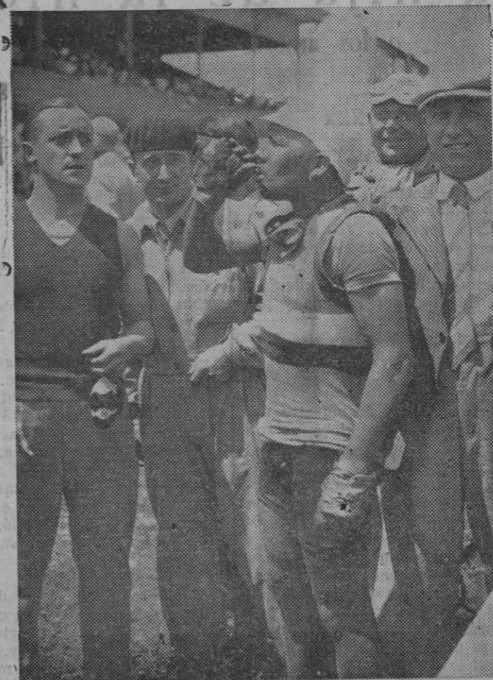
Con gran entusiasmo continúa la vuelta ciclista a Francia, a pesar del gran calor reinante. Un corredor bebiendo agua fresca, en un momento de descanso.

Una vez lograda esa labor, a la que se añadirán otros proyectos de menos fuste, pero igualmente necesarios, se abordará el tema constitucional. Es, entonces, como ya hemos dicho, cuando comienza el tercer periodo y cuando se acometerá la reforma del Gobierno. Los radicales y la CEDA disminuirán su represen-