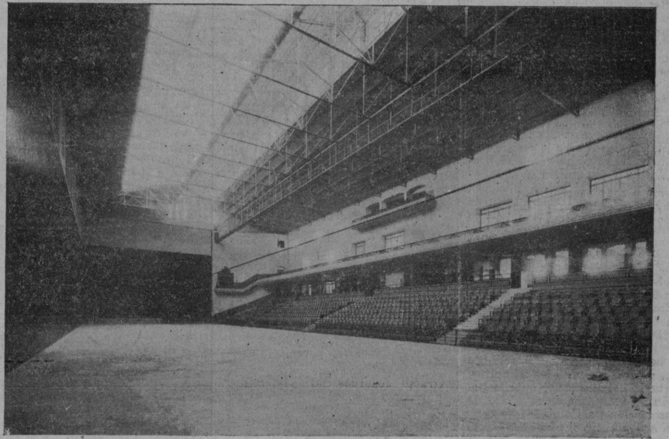
Vista general de la cancha, tribunas y palcos del magnífico Frontón Balear que hoy se abre al público.