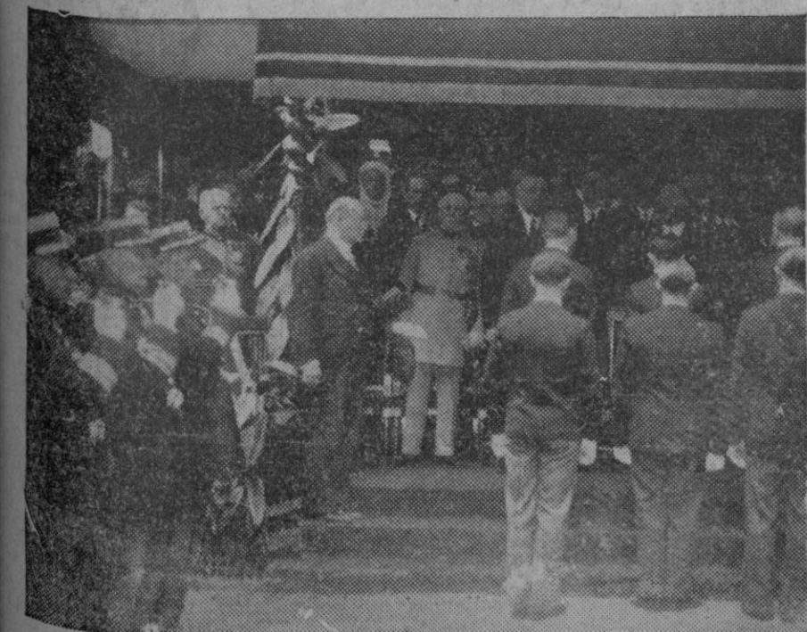
El presidente de la República francesa, M. Lebrún ha condecorado con la Cruz de la Legión de honor, el Instituto Nacional de Agronomía. M. Lebrún poniendo la cruz sobre un escudo sostenido por dos alumnos del Instituto.