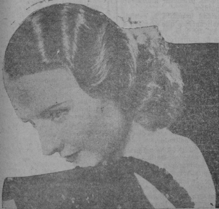
Un caudal de simpatía acrecido por una belleza sin par, son testimonios de esta triunfadora Bárbara Stanwick