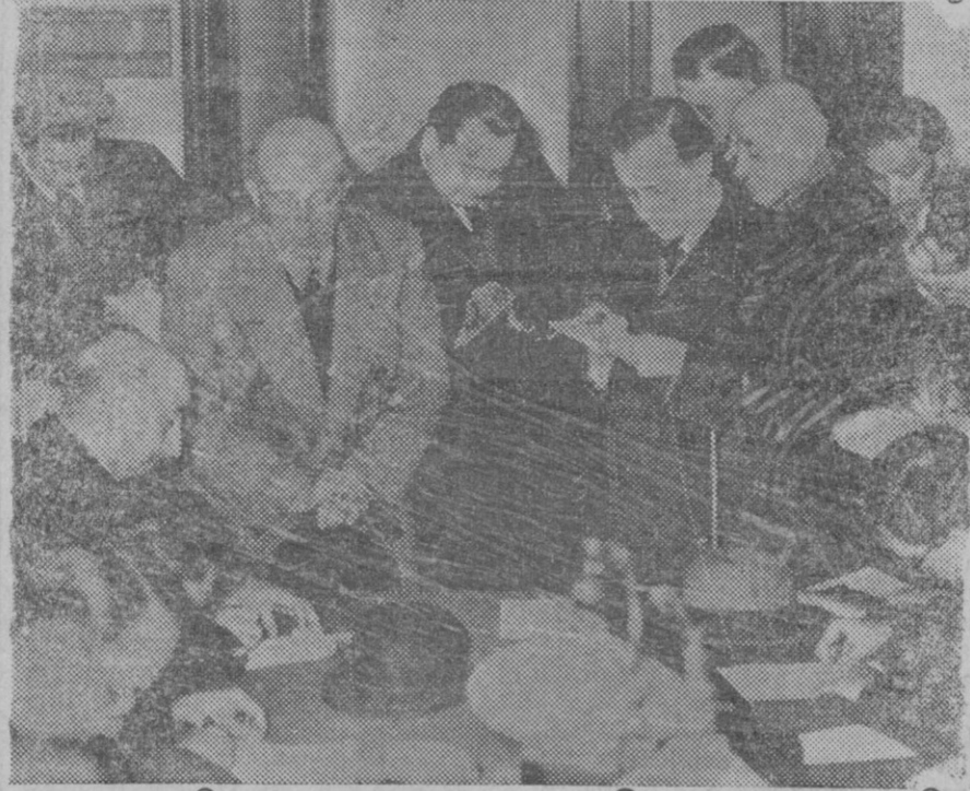
MR. THEUNIS NUEVO PRESIDENTE DEL GABINETE BELGA.—M. Theunis, después de activas gestiones ha conseguido la formación de gobierno. En nuestra fotografía aparece contestando pacientemente a los periodistas sobre el resultado de sus gestiones..

Celebraríamos que fuera esta última la orientación que se siguiera.