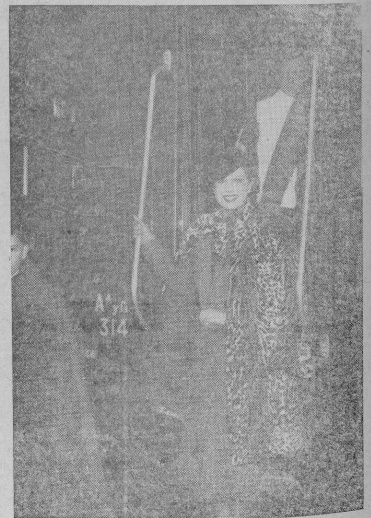
A HOLLYWOOD! — Hollywood continúa siendo el gran centro productor cinematográfico del mundo, a pesar del sensible avance europeo en estos últimos tiempos. Aquí vemos a la simpática artista francesa Lily Damita, saliendo para el Havre camino de Hollywood, atraída por las ofertas sensacionales que de allí recibe.