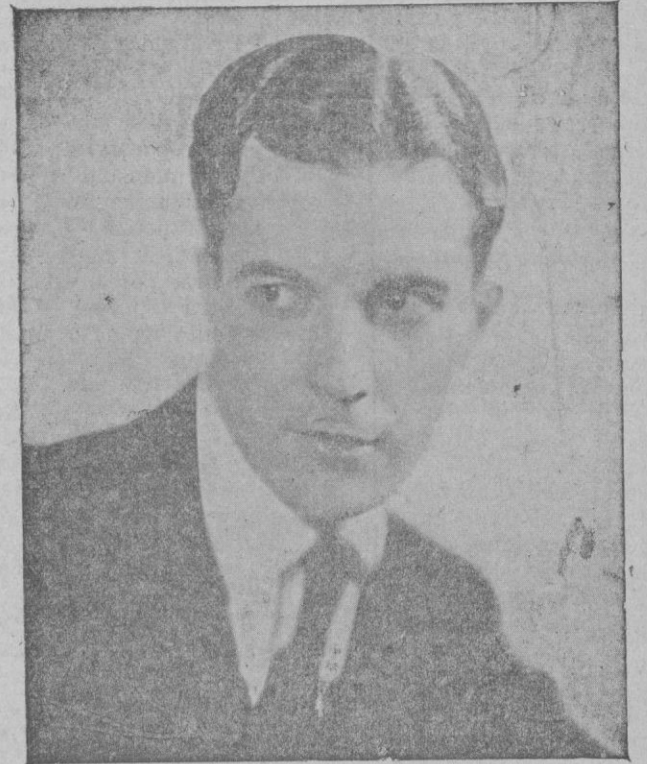
El famoso artista Ramón Novarro, protagonista de la película «El gato y el violín», que con tanto éxito se está protando en el Lírico

Jarck Conway, entre cuyas producciones más destacadas procede citar «Demonios del mar...», una de las grandes películas de 1933, fué el encargado de dirigir «El Solitario». Tanto en la elección de los artistas que caracterizan los diversos personajes como en la pintura de los distintos ambientes en que transcurre la acción. Conway se ha revelado una vez más el «metteur», hábil y de gran sentido artístico que todos reconocen en él.