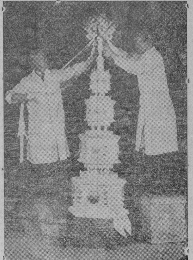
El pastel para la boda de la Princesa Marina con el duque de Kent, es una obra maestra de la pastelería... El más célebre «pastelero» de Londres, ha sido encargado de confeccionar este monumental pastel para la boda principesca. Esta obra maestra de la pastelería inspirada en el arte griego, ha costado cerca de 500 libras esterlinas.

Abisinia nos compró en 1933 mercancías por valor de 308 pesetas. El Congo belga donde España adquiere caucho, marfil colonias y madera, no nos compró una sola peseta. Bul-