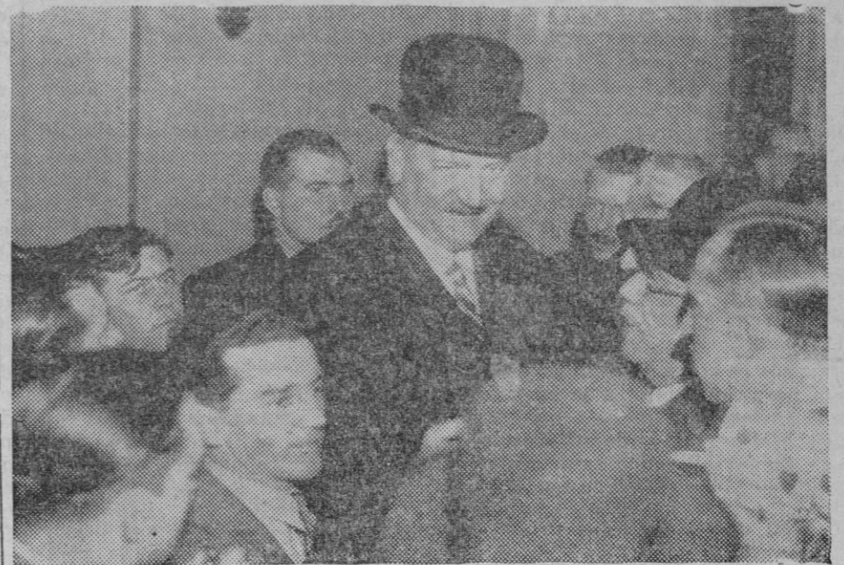
EL SR. FLANDIN HA FORMADO EL NUEVO GOBIERNO DE FRANCIA. — El nuevo Presidente del Consejo de Ministros francés, hablando con los periodistas en el Ministerio de Trabajos Públicos. (Express Foto).