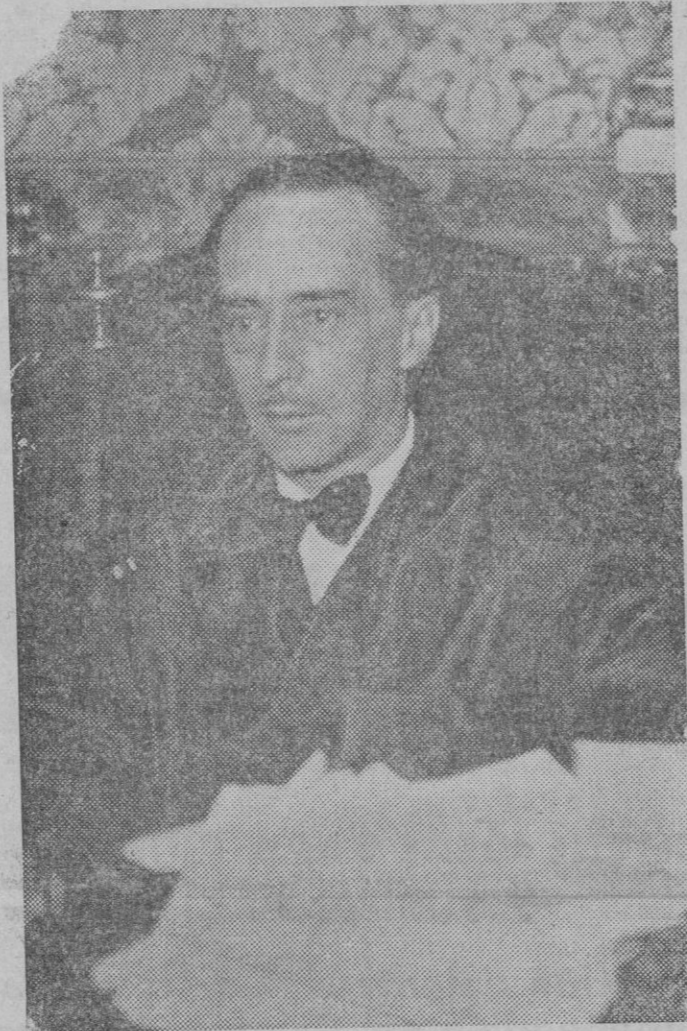
EL NOMBRAMIENTO DEL GOBERNADOR GENERAL DE ASTURIAS. — El auditor general asesor del Consejo Superior de Guerra, don Onofre Sastre, que ha sido designado por el gobierno, Gobernador General de Asturias.