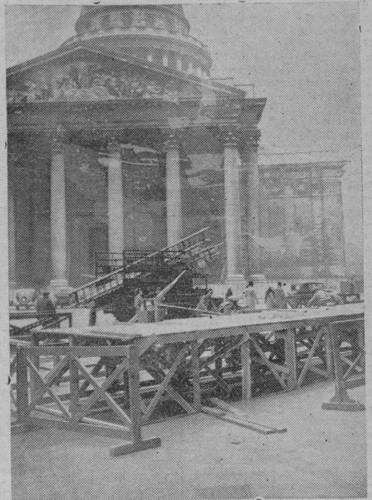
PARIS. — Preparativos en el panteón para la exposición de los restos mortales de Raymond Poincaré. — Con gran actividad se están haciendo las obras necesarias para la solemne exposición al público del gran político, en el Panteón. El proyecto de decoración ha sido hecho por M. Huisman, director General de Bellas Artes y por Mr. Ventre, arquitecto jefe de Monumentos históricos. Los preparativos ante el Panteón.