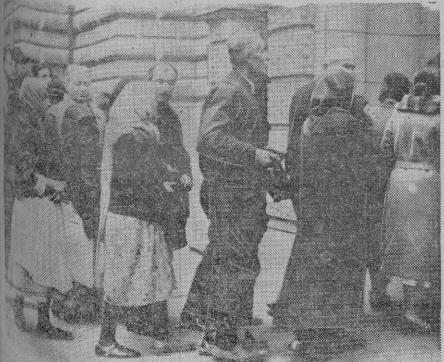
EL HOMENAJE DEL PUEBLO DE YUGOESLAVIA A SU DIFUNTO REY ALEJANDRO I.—Desde su llegada, el pueblo yugoeslavo ha dado a su difunto rey pruebas de verdadero sentimiento y el desfile del pueblo ante sus restos mortales, expuestos en el antiguo palacio de Belgrado no ha cesado un momento. El público, de todas las clases sociales, haciendo cola ante el Palacio de Belgrado para desfilarse ante el cadáver del rey, Alejandro.